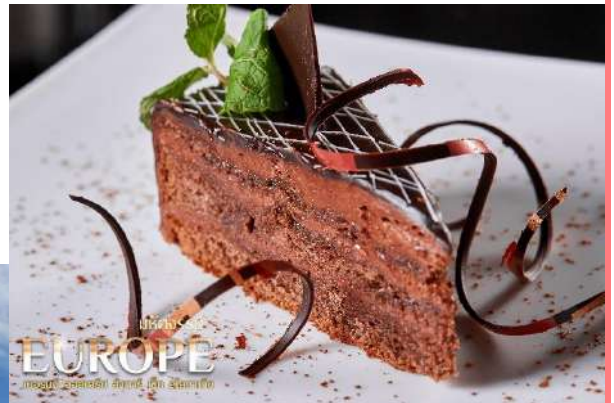
มหัศจรรย์ EUROPE เยอรมัน ออสเตรีย ฮังการี เช็ก สโลวาเกีย

เมนู พิเศษ Sacher Cake เค้กสุดคลาสสิก ของเวียนนา