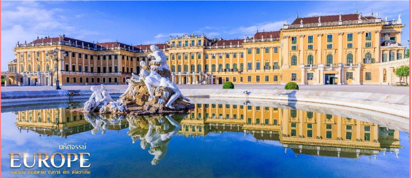
มหัศจรรย์ EUROPE เยอรมัน ออสเตรีย ฮังการี เช็ก สโลวาเกีย